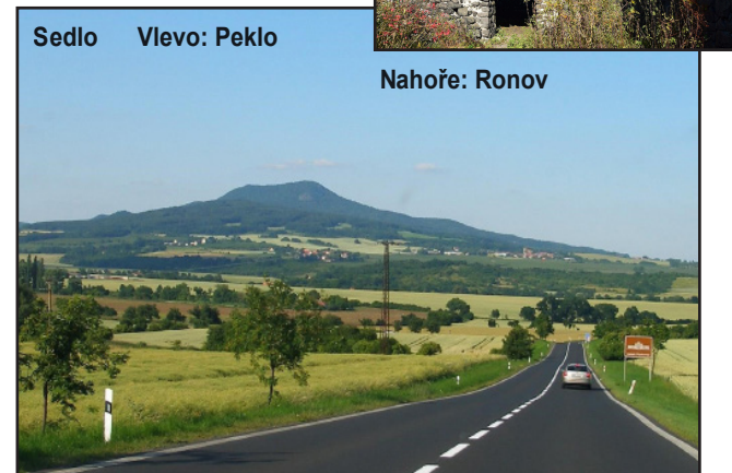
Sedlo Vlevo: Peklo