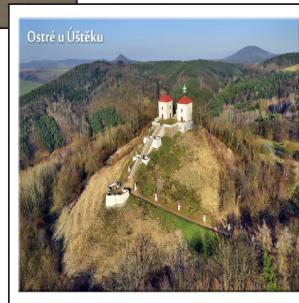
Ostré u Úštěku